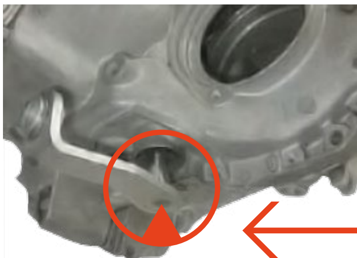
MAPCO Art.-Nr.: 19199

Die Reparaturzeit verringert sich auf eine Stunde gegenüber den acht Stunden, die durch den Kfz-Hersteller für die Reparatur der Dichtung veranschlagt wird.