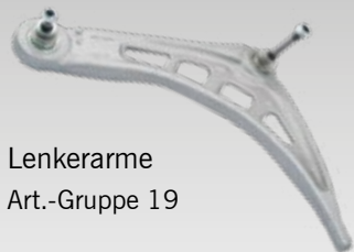
Lenkerarme Art.-Gruppe 19