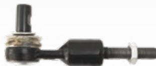
Spurstangenköpfe Art.-Gruppe 19