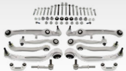
Reparatursätze Radaufhängung inkl. Montagesatz Art.-Gruppe 19