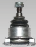
Traggelenke Art.-Gruppe 19