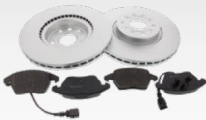
Carbon-Bremsensätze Art.-Gruppe 47